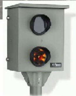
Via Milano - Merano