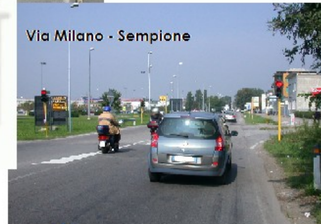
Via Milano - Sempione

COMUNE di BARANZATE Provincia di Milano COMANDO DI POLIZIA LOCALE Via Mercantese 14 Tel. 02 92851615 Fax 02 92851617 e-mail : polizia.locale@comune.baranzate.mi.it