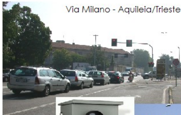
Via Milano - Aquileia/Trieste